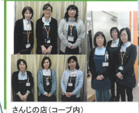
さんじの店(コープ内)